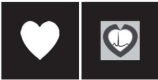
Figura 6. Marcadores de realidad aumentada.

Para una comprensión más real del tema, en este número de la Revista Colombiana de Cardiología se incorporará por primera vez la realidad aumentada, donde encontrarán una separata dentro de la misma con las instrucciones puntuales para llevar a cabo la experiencia. En dicha hoja hay impresos dos marcadores (Figura 6) para